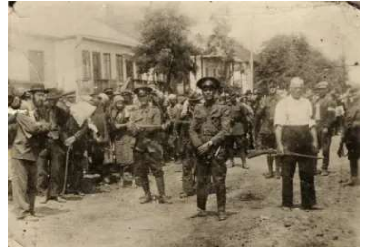
Бричева, Бессарабия, 1941 г. Евреи перед депортацией в Транснистрию

Осенью 1941 года левобережье Днестра покрылось сетью концлагерей и гетто, где были размещены евреи, прибывшие из Бессарабии, Буковины и некоторых районов Украины. Также здесь находились евреи, проживавшие в Приднестровье. Регион стал свидетелем самых страшных зверств и преступлений. Во всех гетто узники подвергались унижениям, насилию, издевательствам и систематическому уничтожению. Условия содержания были нечеловеческими: голод, холод, болезни и произвол охраны ежедневно уносили тысячи жизней. Помимо евреев жертвами политики геноцида стали и цыгане. Десятки тысяч из них были замучены, расстреляны или погибли в лагерях и гетто.