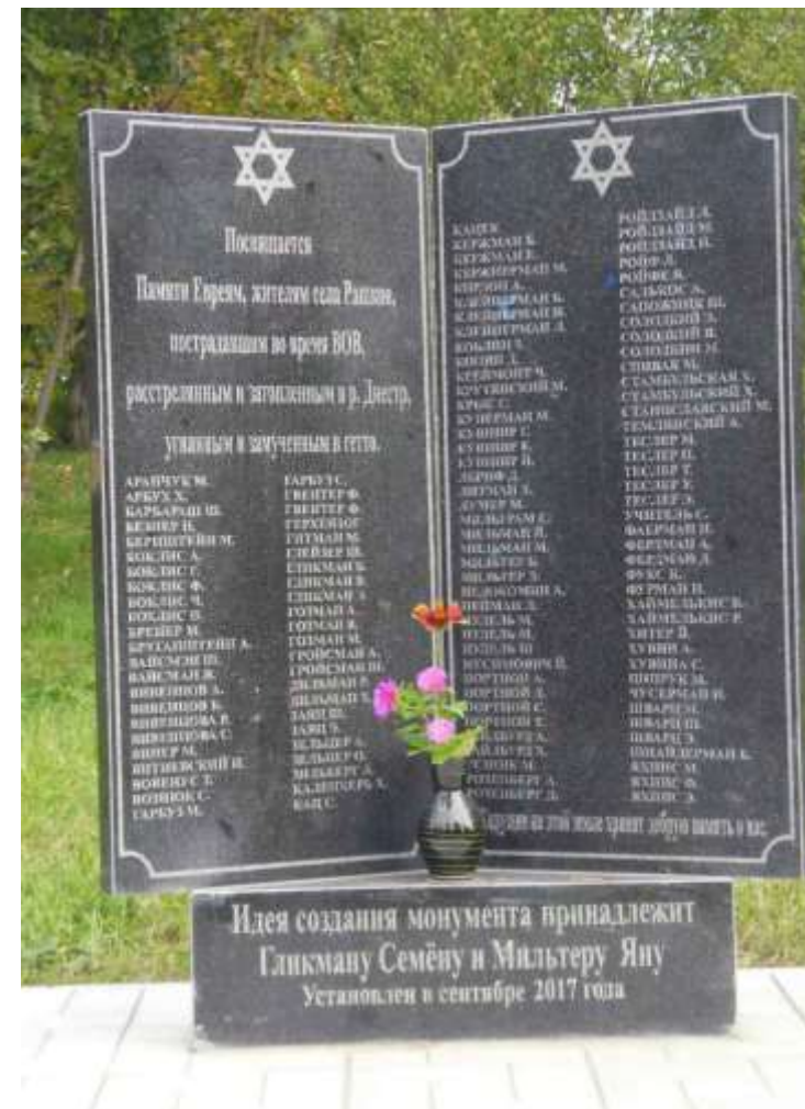
Памятник евреям, жителям села Рашков, погибшим и угнанным в гетто период оккупации. Установлен в 2017 г.