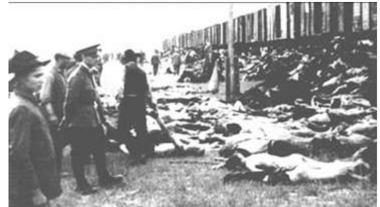
На пути в гетто, губернаторство Транснистрия