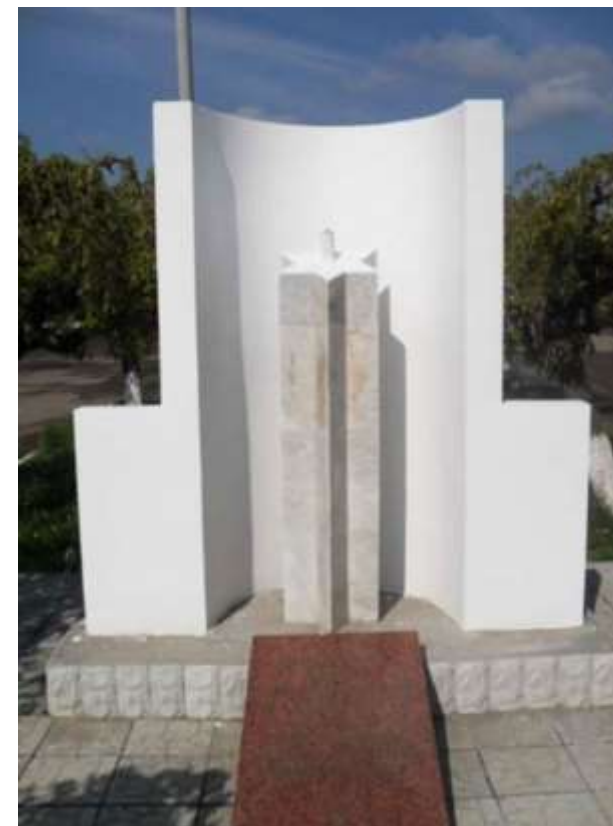
памятник каменчанам, погибшим в период немецко-румынской оккупации

В сентябре 2017 года в центре села Рашков был установлен памятник из черного гранита. Монумент представляет собой раскрытую книгу, на страницах которой приведены фамилии погибших жителей села. На памятнике имеется надпись «Посвящается памяти евреям, жителям села Рашков, пострадавшим во время ВОВ, расстрелянным и затопленным в р. Днестр, угнанным и замученным в гетто.»