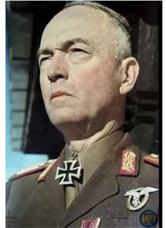
Ион Антонеску, кондукэтор Румынии, военный преступник. Расстрелян по приговору народного трибунала в 1946 г.

Создание гетто и концентрационных лагерей в Приднестровье стало следствием политики властей Румынии по выселению из Бессарабии и Буковины нерумынского населения любыми доступными средствами, не взирая на закон и нормы морали. Так, 8 июля 1941 года, выступая на заседании румынского правительства по вопросу выселения евреев и украинцев из Бессарабии и Буковины, румынский диктатор Ион Антонеску заявил: «Я прошу вас быть беспощадными. Пустому слащавому гуманизму не должно быть здесь места. Рискую остаться непонятым некоторыми традиционалистами, которые могут находиться среди вас, я выступаю за насильственное выселение евреев из Бессарабии и Буковины. Они должны быть выброшены за границу... Не знаю когда, через сколько веков румынская нация снова обретёт столь же полную свободу действий для своего этнического очищения. Сегодня мы являемся хозяевами своей территории. Воспользуемся этим. Мне безразлично, войдём ли мы в историю как варвары. Не было в истории более подходящего для нас момента. Если есть надобность, стреляйте из пулемёта. Полная свобода. Я беру на себя всю ответственность и ещё раз заявляю: закона не существует».