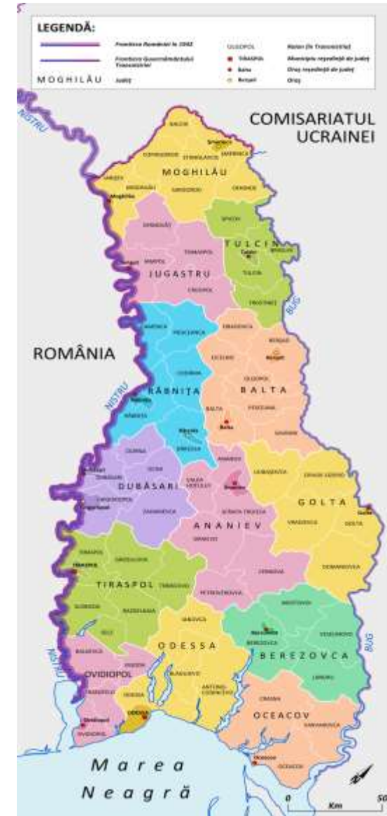
Карта административно-территориального деления Губернаторства Транснистрия

После оккупации Молдавии на обоих берегах Днестра была создана разветвлённая сеть гетто и концентрационных лагерей. В августе 1941 года по распоряжению румынского диктатора Иона Антонеску на территории Бессарабии было создано 49 лагерей и гетто. Позднее оккупационные власти приняли решение депортировать всех евреев в Транснистрию.